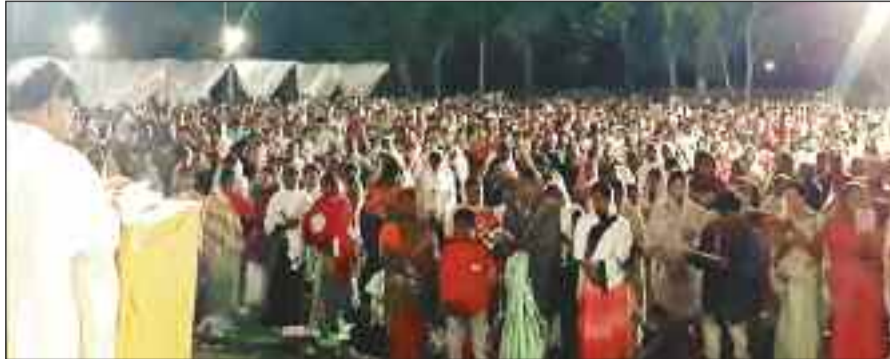
पवित्र पूजन में शामिल ईसाई समाज के लोग।

ईसाई धार्मिक ग्रंथ के अनुसार इस दिन ईसा मसीह को सुली पर लटकाए जाने, मर जाने और कब्र में दफनाए जाने के पश्चात् तीसरे दिन ईसा मसीह मृतकों में से पुनर्जीवित हो गए। यह एक मान्यता है कि ईसा मसीह तमाम विश्वासियों के मुक्ति और सारी दुनिया को पापों से छुटकारा दिलाने के लिए अपने जीवन की कुर्बानी आहुति दी। इस पावन अवसर को ईसाई जगत में