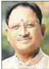
मुख्यमंत्री विष्णुदेव साय।

उल्लेखनीय है कि बीते वर्ष 2023 में भारतीय जनता पार्टी ने विधान सभा चुनाव में मोदी की गारंटी के नाम से घोषणा पत्र जारी