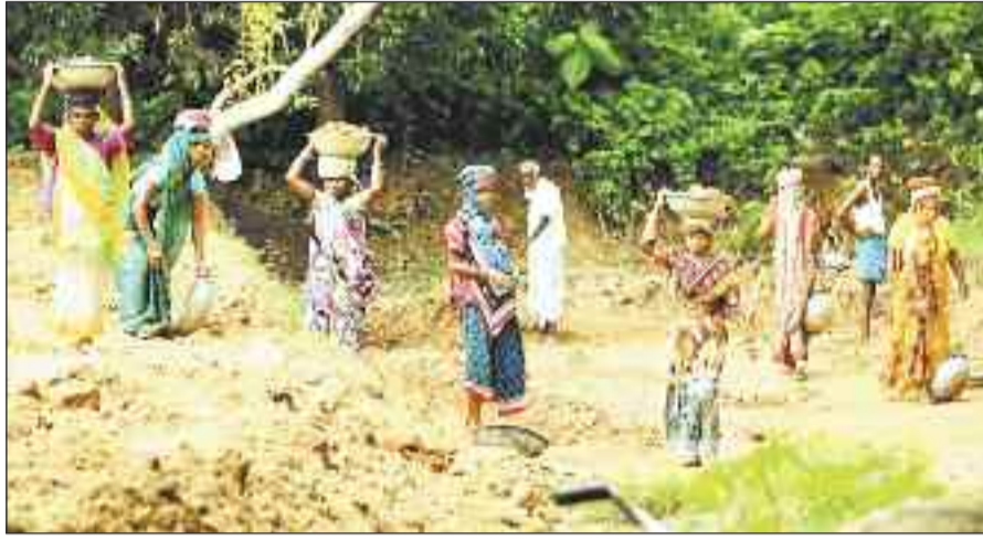
मनरेगा में काम करते मजदूर।

गर्मी के दिनों में मनरेगा के तहत अधिकतर कार्य होते हैं, किंतु इस बार लोकसभा चुनाव के लिए लागू आदर्श आचार संहिता लागू होने के बाद से ही अचानक कार्यरत मजदूरों की संख्या में कमी देखने को मिल रही है। वहीं इसके साथ ही पलायन भी होने शुरू हो गया है। गर्मियों के समय ही मनरेगा के तहत काफी संख्या में कार्य किए जाते हैं। यह समय निर्माण कार्य के लिए काफी सही माना जाता है। इसलिए इस सीजन में अधिक से अधिक मजदूरों को लगाकर काम लिए जाने को लेकर समय समय पर निर्देश दिए जाते रहते हैं। इन कार्यों को बारिश से पहले ही खत्म करना होता है। ऐसे में गर्मियों के दिनों में ही