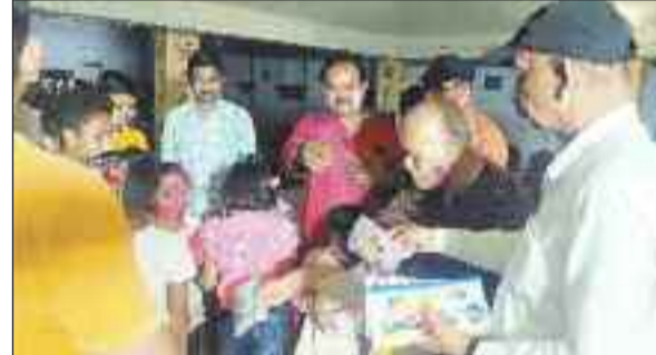
होली मिलन समारोह मनाते हुए।

बालाजी मंदिर प्रांगण में शनिवार को उत्कल ब्राह्मण परिषद जशापुर के तत्वाधान में होली मिलन समारोह का आयोजन किया गया। जिसमें नगर के समस्त उत्कल ब्राह्मण परिवार सम्मिलित हुए। कार्यक्रम की शुरुआत में समाज के वरिष्ठ जनों द्वारा मन्त्रोच्चार के साथ जगन्नाथ महाप्रभु एवं मां सरस्वती के समुख दीप प्रज्वलित कर किया गया। तत्पश्चात समाज की महिलाओं द्वारा सरस्वती वंदना प्रस्तुत किया गया। इस अवसर पर उपस्थित समस्त सदस्यों द्वारा सामूहिक हनुमान चालीसा पाठ भी किया गया।